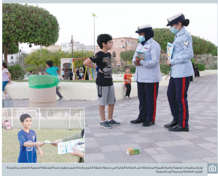
لوزج مطوعات هومية خاصة أهمية المحافظة على النظافة العامة في حديقة طرقة الكبرى بالبرامض من جهود لجنة المنطقة الجنوبية بالتعاون مع شركة أوبريزر، للنظافة وحديقة أمن الجنوبية.

نصيحة تفاعل الناس مع الحكومة مؤشر قوي على التعافي بعد ذاته يستقيمه الناس وكذلك المراقبون وينعكس في تقاريرهم، متفائلون هذه المرة ونتمنى أن يكون شعورنا في محله، أشرف إلى ذلك أن لدينا مؤشرات تدعو للتفاؤل بالإمكان الاستناد إليها تجعلنا نأمل أن تكون على الطريق الصحيح، أولها نجاح برنامج التوازن المالي وذلك لم يكن سهلاً أبداً في ظل تحدياتنا وهذا ما قاله وزير الخزانة الأمريكي السابق ستيف مانشون حين التقى بالشيخ سلمان بن خليفة قائلا «وزير المالية المعطل»، وثالثها نجاح إستراتيجية مواجهة الأزمات وبدلها «الحائكة» فقد تخطينا إستراتيجيات دول عظمى بتناجنا، وثالثها - وقد تستغربون - أن الكيفية التي حصلت لنا لنحدث في الجائحة كانت -ككسوة- من الأمور المتوقعة، ويمكن أن تحدث لنا ولاي أحد آخر أثناء الضرور بأي أزمة، إزومنا منها ومعالجتها بتلك السرعة والجرأة في إعادة التقييم، يعني أننا أمام فريق حاضر ومتمكن، وتلك هي القيادة التي تطعك شعوراً بأنك بأيدي أمانة.