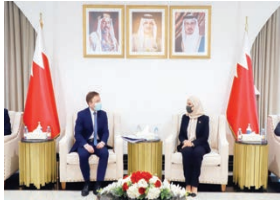
رئيسة مجلس النواب تلقي وفد البرلمان الأوروبي.