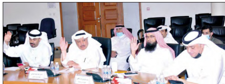
اجتماع مجلس بلدي المحرق

طلبت المواطنين إضافة مصاعد إلهاميه السكنية في الأبراج وذلك بسبب احتياجاتهم لتلك المصاعد نظراً لحالتهم العيشية، أو لوجود حالة مرضية أو يكون ضمن أفراد عائلتهم نظراً لوجود كبار السن أو العاقين أو إحدى الحالات الخاصة أو أصحاب الهمم والتي تستلزم وجود تلك المصاعد في مبني سكنهم، والذين هم في أمس الحاجة إلى هذه الإضافات، لتخفيف من أعبائهم. ولغيت إلى أن أكثر تلك الحالات تتعلق بالبيوت القديمة، التي لم يكن المصعد يشكل أمراً مهماً بالنسبة لها، لعدم أخدمه بعين الاعتبار ما يمكن أن يعطيه المصعد من حاجة مستقبلية لهم في حال العجز أو الإعاقة وغيرها من الظروف الخاصة. وطالب المجلس الجهات المعنية في وزارة التربية والتعليم وعلى رأسهم وزير التربية بضرورة التعرّف لإعادة إحياء العمل في المدارس النمام التي تم إغلاقها منذ 3 سنوات، مؤكداً أنه لا يجوز تعطيل المرافق العامة أو إخراجها عن العمل. وطالب وزارة الأوقاف بضرورة العمل على إحياء هذه المدارس مرة أخرى، سوى بالهدم أو إعادة الأحياء.