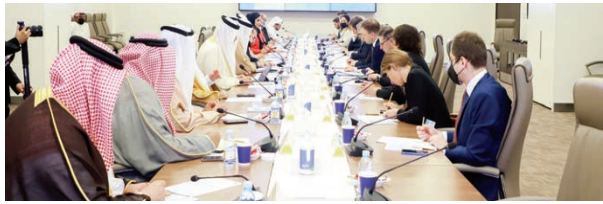
اجتماع لجنتي الشؤون الخارجية وحقوق الإنسان مع وفد البرلمان الأوروبي.