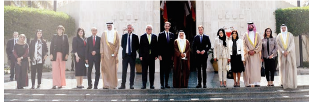
وفد البرلمان الأوروبي خلال زيارته لمجلس الشورى.